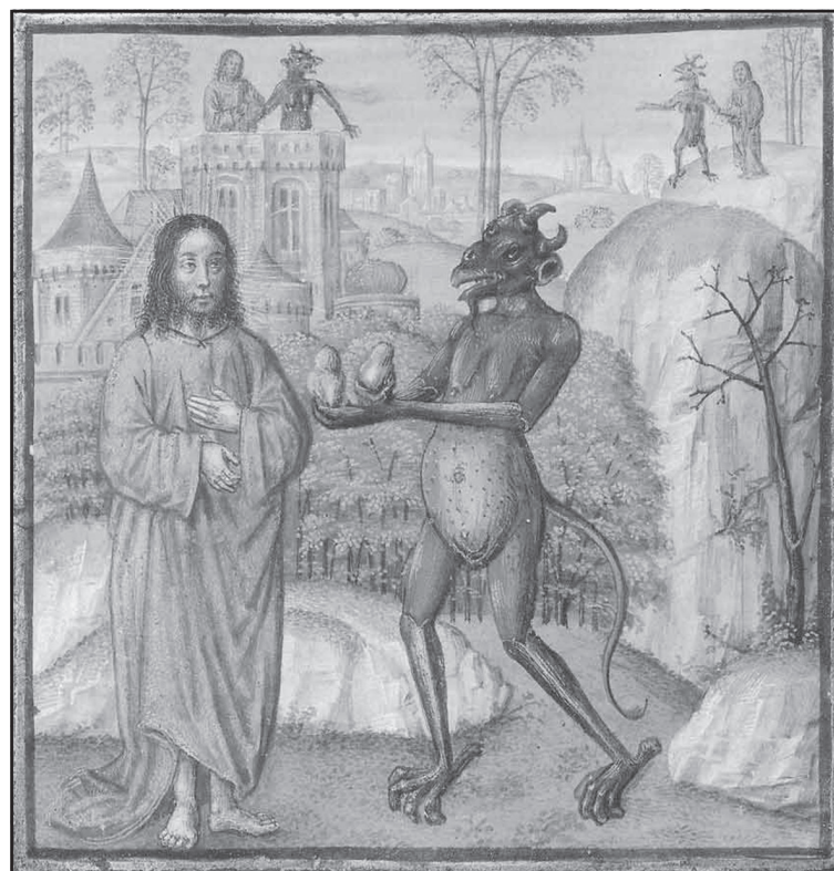
Трите изкушения - френска икона от XV век