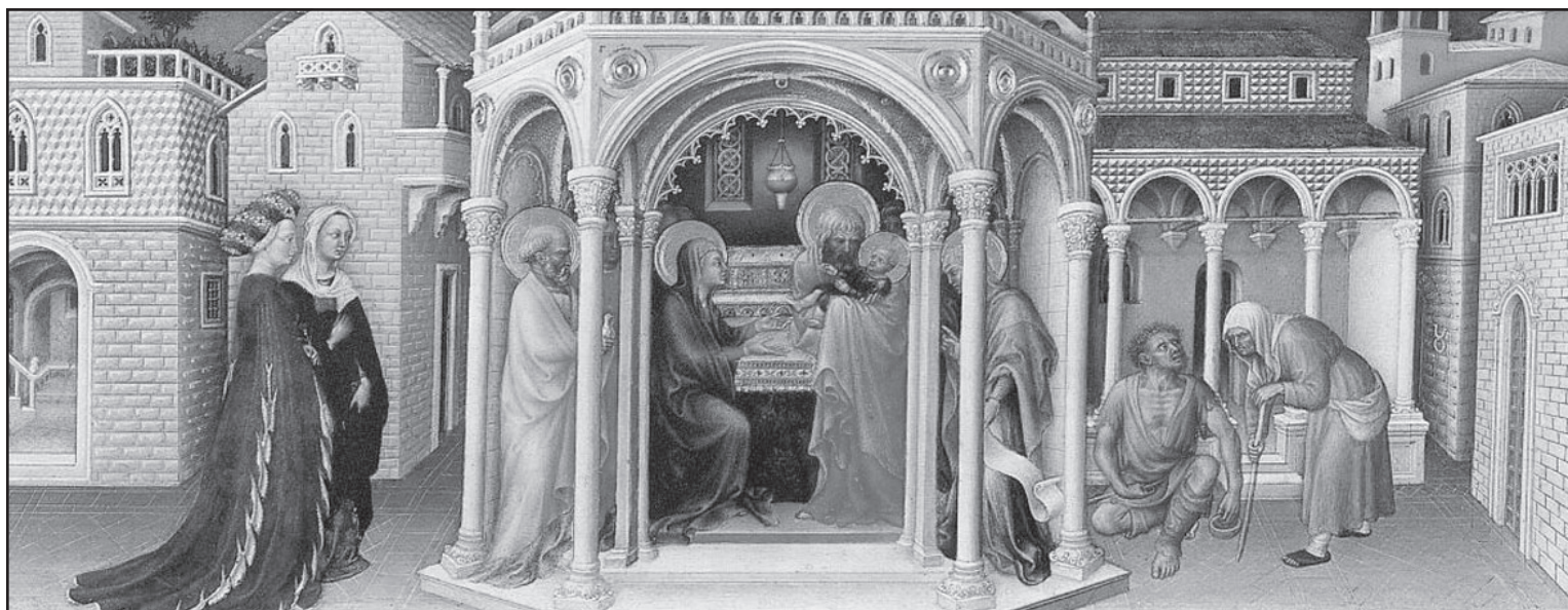
„Представяне в храма“ - Джентиле да Фабриано