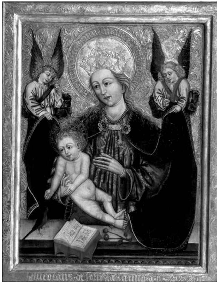
Дева Мария Богородица, икона от Словения, около 1484 г.