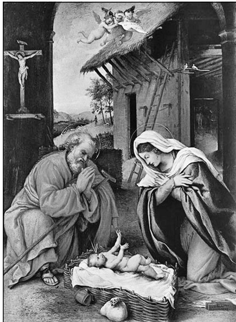
„Рождество“ - худ. Лоренцо Лото, 1523 г.

Нека да бъде свято и благословено Рождеството на Христос, нашия Господ, Единородния Син Божий, Който стана като нас човек, за да станем и ние в Него обогатени чрез Неговата божественост.