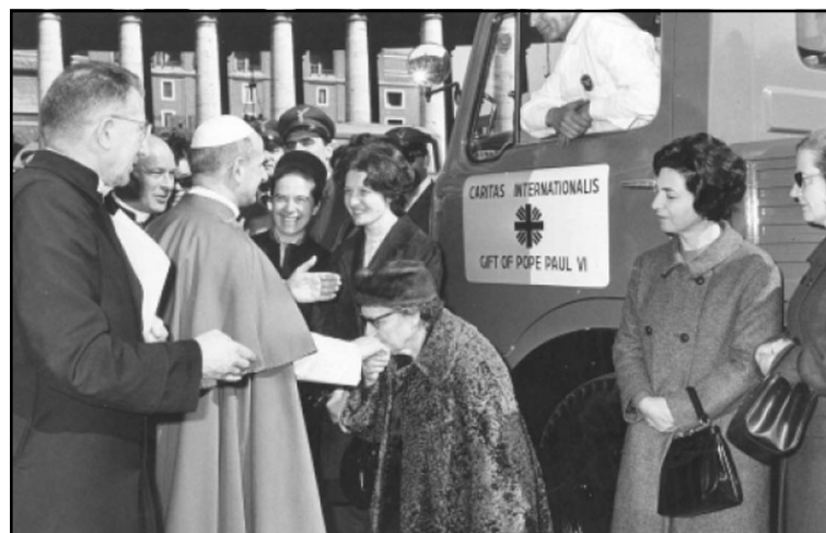
Папа Павел VI благославя хуманитарна помощ през 1966 г.

„За мира е важна не само липсата на война, основана на несигурния баланс на властта, важни са насочените усилия ден след ден към установяване на световен ред по волята Божия с повече справедливост между хората.“