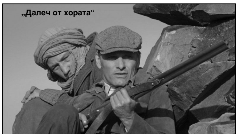
„Далеч от хората“