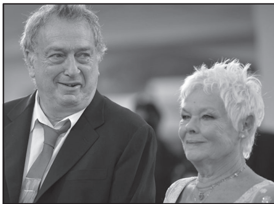
Стивън Фриърс и Джуди Денч