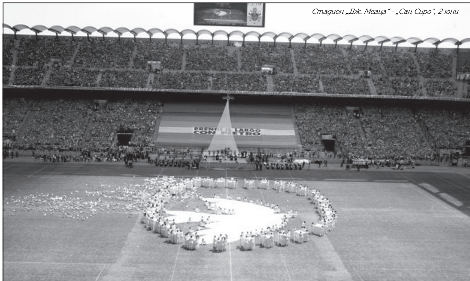
Стадион „Дж. Меаца“ - „Сан Сиро“, 2 юни