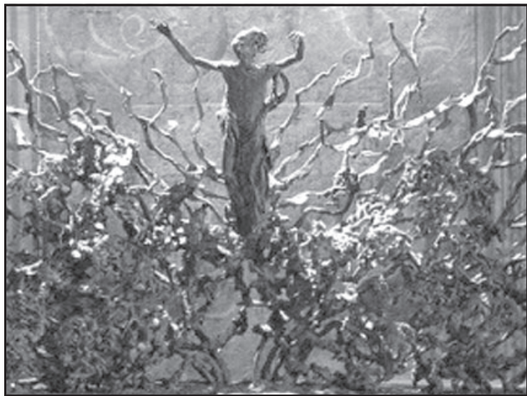
Перикле Фадини - „Възкресение“, фрагмент