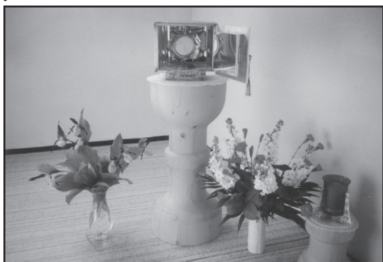
Параклисът в „Йозефсхайм“

Няколко месеца по-късно в същата година (2003) в ръцете ми „случайно“ попадна програмата за един международен конгрес на „Кирхе ин Нот“, който щеше да се състои в Аугсбург. Разглеждайки я, изненадващо видях българско участие от страна на Об-