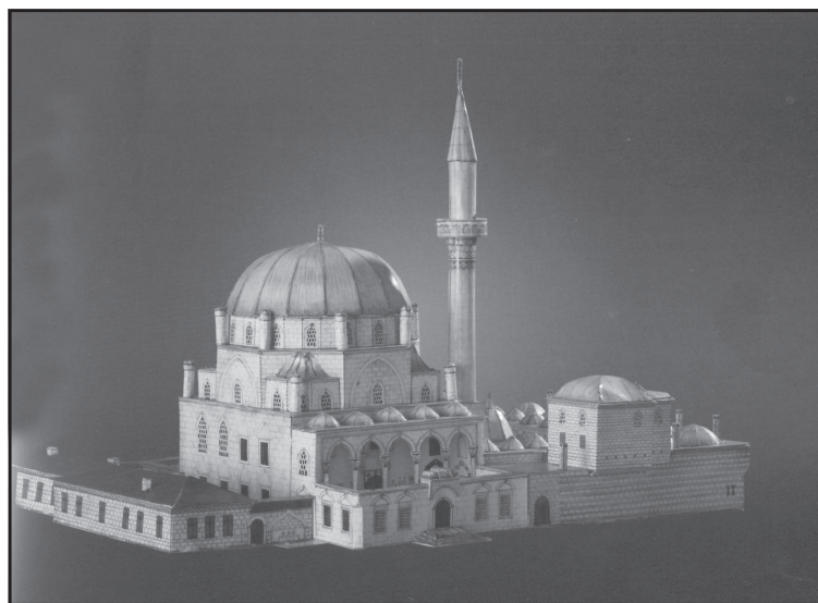
Стефано Бенацо Томбул джамия в Шумен

И за каква толерантност може да става дума в условията на триумфиращата агресия, при обезценяването на всичко, що има някакъв смисъл, в името на светска слава и фалшиви ценности. Та нали ВЯРАТА обуславя феномена толерантност! Вярата, че другият, макар и изповяд-