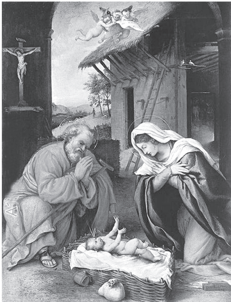
„Рождество“ - Худ. Лоренцо Лото, 1523 г.

Нека да бъде свято и благословено Рождеството на Христос, Нашия Господ, Единородния Син Божи, Който стана като нас човек, за да станем и ние в Него обогатени чрез Неговата божественост.